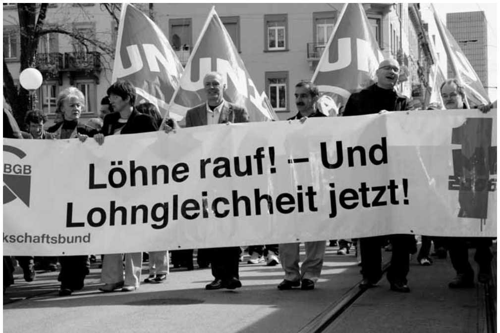
Für bessere Löhne auf die Strasse: 1. Mai in Basel.

Die Unia geht selbstbewusst in die kommende Lohnrunde: Jetzt steht allen ein Anteil am Aufschwung zu. An der nationalen Lohndemo vom 23. September verleihen wir dieser Forderung besonderes Gewicht.