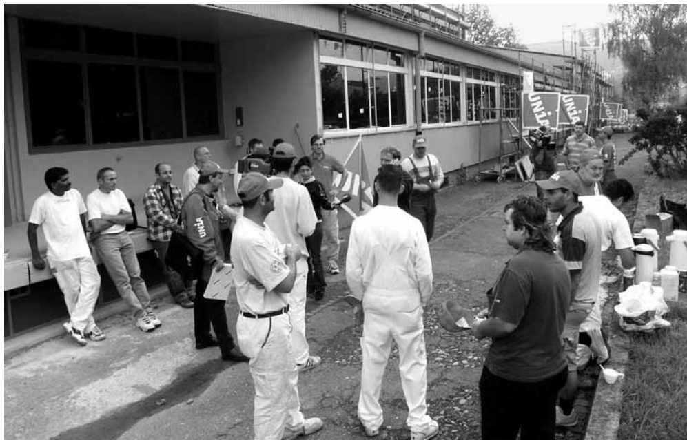
Warnblockade der Unia bei der Bista AG in Therwil.