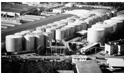
Vopak-Tanklager in Birsfelden.

Das Beispiel Vopak zeigt: Wenn die Belegschaft es will, bietet die Unia Hand für einen Gesamtarbeitsvertrag.