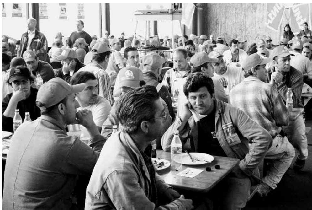
Unia-Info-Aktion in der Voltahalle.

der Kampagne für die Frühpensionierung gewesen war, informierte die Unia die Bauleute während ihrer Mittagspause über die radikalen Pläne des SBV. Besonders der SBV-Vorschlag einer 6-Tage-Woche und die angedrohte Verschlechterung der Krankentaggeldversicherung macht die BauarbeiterInnen wütend. Die Anwesenden erteilten den Abbauplänen eine deutliche Abfuhr und beschlossen, den für 13. Juni geplanten Warnstreik zu unterstützen, sollten die Baumeister nicht Verhandlungen auf Basis des aktuellen LMV aufnehmen.