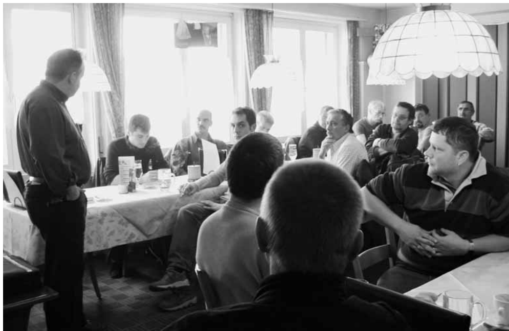
Die betroffenen Arbeiter werden von Unia und Personalvertretung über den Stand der Dinge informiert.