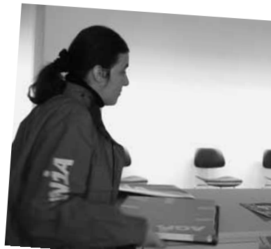
11 Uhr Zurück im Gewerkschaftshaus: eine Sitzung muss vorbereitet werden.