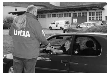
GAV MEM Industrie: Die Unia informiert und mobilisiert

Le 13 septembre dernier, le syndicat Unia organisait une action de protestation contre le démantèlement des conventions collectives de travail par Rhenus Alpina AG. En effet, huit mois après la création de la nouvelle société holding, cette entreprise active dans la logistique a unifié les conditions de travail de ses différents services sans associer les syndicats ou les représentations du personnel. Cette mesure concerne environ 700 ouvriers et employés de bureau qui font face à une série de dégradations de leurs conditions de travail. Le temps de travail est ainsi rallongé pour la plupart d'entre eux, qui travailleront 180 heures par année de plus pour certains.