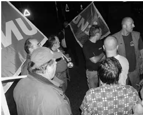
Warn-Aktion frühmorgens bei Rhenus Alpina.

Die Logistik-Unternehmung Rhenus Alpina verabschiedet sich aus der Sozialpartnerschaft.