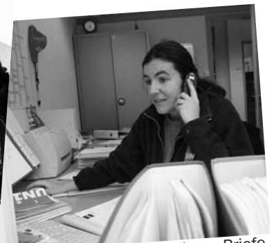
17.30 Uhr Telefonate erledigen, Briefe schreiben: Viel Büroarbeit gehört auch dazu.