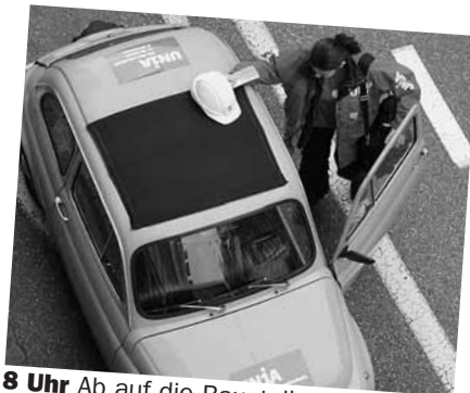
8 Uhr Ab auf die Baustelle: Die Gewerkschaftssekretärin hat heute Aussendienst.